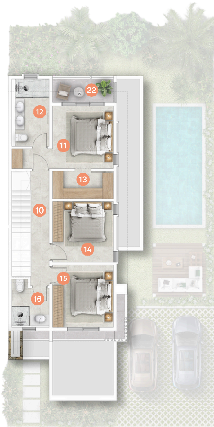
Garden Villa - First Floor