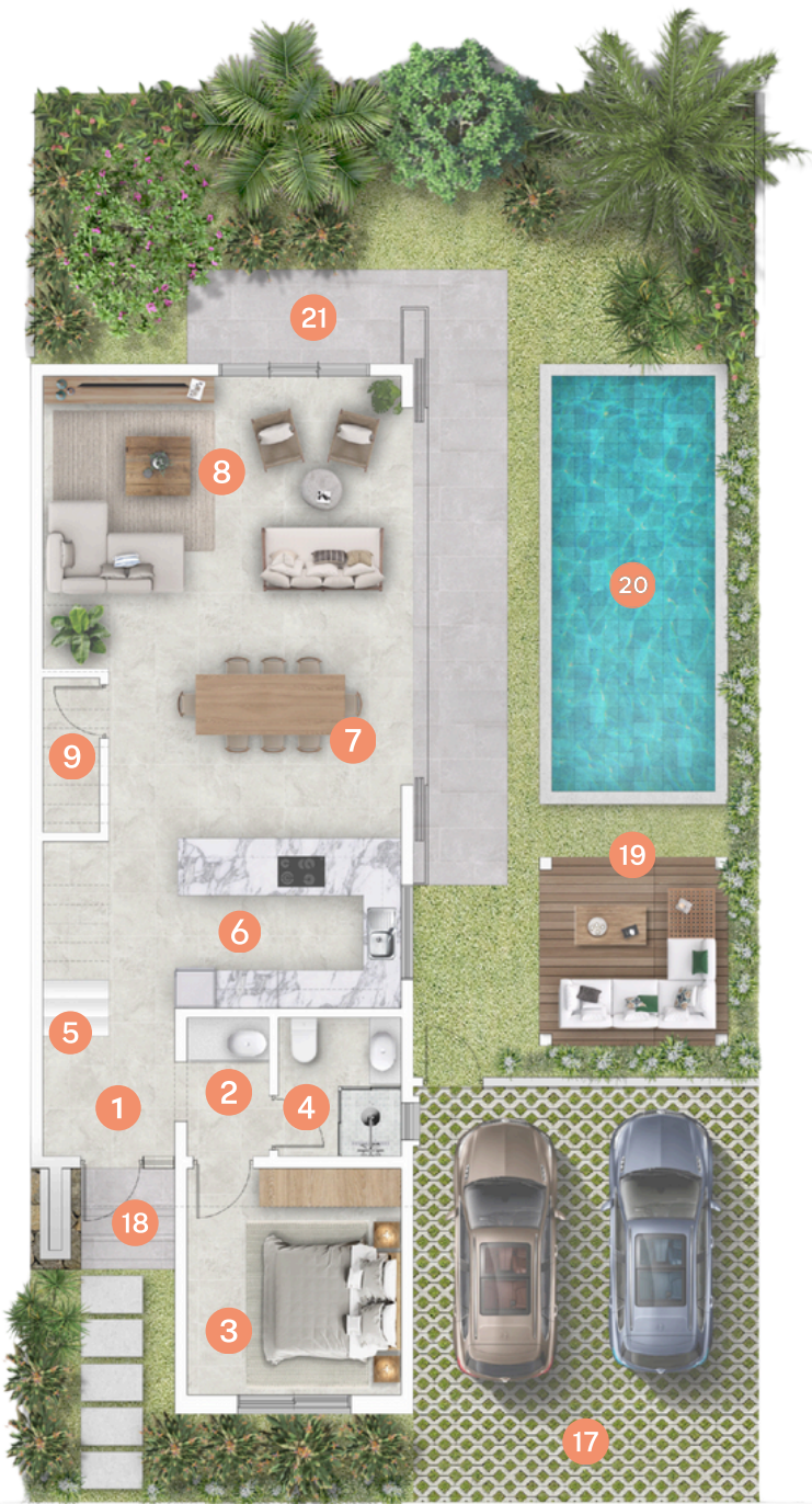
Garden Villa - Ground Floor